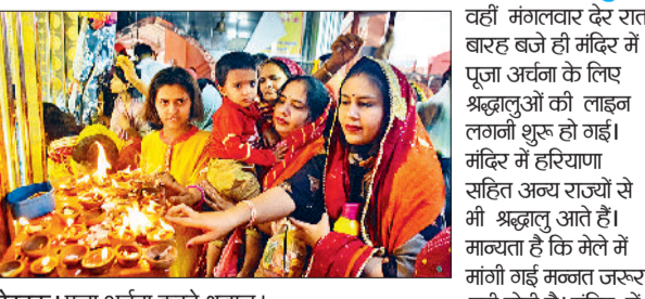
रोहतक। पूजा अर्चना करते श्रद्धालु।

वहीं मंगलवार देर रात बारह बजे ही मंदिर में पूजा अर्चना के लिए श्रद्धालुओं की लाइन लगनी शुरू हो गई। मंदिर में हरियाणा सहित अन्य राज्यों से भी श्रद्धालु आते हैं। मान्यता है कि मेले में मांगी गई मन्तल जरूर पूरी होती है। मंदिर में गुड़ के बने पकवानों का भोग लगता है। वहीं जब भी मेला लगता है, मंदिर के बाहर दुकानें लगती हैं, जहां से श्रद्धालु खरीदारी करते हैं। मंदिर के बाहर जाम की स्थिति रही शीतला माता मंदिर में भक्तों की आस्था के चलते दर्शनों के लिए भारी भीड़ रहती है। श्रद्धालुओं की कतारें मंदिर के बाहर तक पहुंच जाती हैं। जिससे जाम की स्थिति उत्पन्न हो जाती है। हालांकि पुलिस व्यवस्था को सुचारू रूप से चलाने में कोई कसर नहीं छोड़ती। पुलिस के जवान ट्रैफिक को सुचारू रूप से चलाने में सहयोग करते हैं। दर्शन करने के लिए मंगलवार रात को करीब 9 बजे से ही श्रद्धालु पहुंचना शुरू हो गया। मंदिर में पूजा के बाद भक्तों के लिए काफ़ट खोले गए। इसके बाद सात दिन श्रद्धालुओं का आना जाना लगा रहा। तीन सौ मीटर की दूरी तक लाइनें लगीं रहीं। पूरा मंदिर परिसर माता के जयकारों से गूंज उठा।