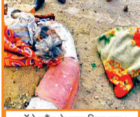
ऑटो स्टैंड के पास मिला शव।

पोस्टमार्टम करावा दिया गया है और शव की शिनाख्त के प्रयास किए जा रहे हैं।