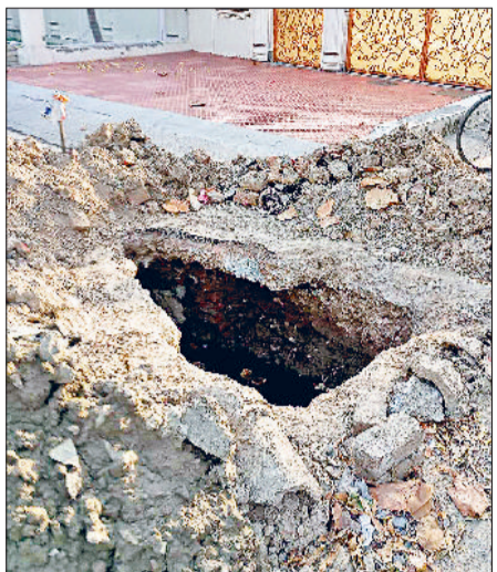
रोहतक। तिलक नगर में खोदा गया गड्ढा।