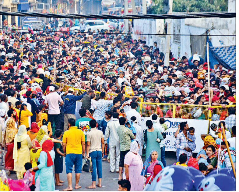
रोहतक। माता दरवाजा स्थित प्राचीन श्री शीतला माता मंदिर के बाहर लगी श्रद्धालुओं की भीड़।