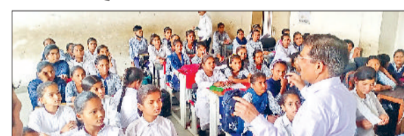
रोहतक। विद्यार्थियों को दांतों को साफ करने की जानकारी देते हुए डॉक्टर।

रोहतक। वलड ओरल हेल्थ जागरूकता अभियान के अंतर्गत स्वास्थ्य केंद्र कलानेर से चिकित्सकों की एक टीम ने राजकीय कन्या चरित्रक माध्यमिक विद्यालय कलानेर में छात्राओं को दांतों की साफ-सफाई और रखरखाव से संबंधित जानकारी दी। चिकित्सकों ने विद्यार्थियों को दांतों को साफ करने का सही तरीका, जंक फूड के प्रयोग से बचने, मोटा अनाज खाने के फायदे आदि से अवगत करवाया। उन्होंने यह भी बताया कि दांतों की साफ-सफाई और रखरखाव से अंगर ठंडा गरम लगना शुरू होता है, तो हमें लापरवाही नहीं करनी चाहिए और तुरंत ही दंत चिकित्सक को दिखाना चाहिए।