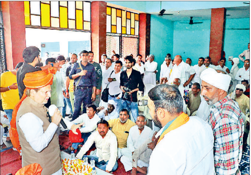
रोहतक। महम हलके के गांव में जनसम्पर्क अभियान के दौरान ग्रामीणों को संबोधित करते भाजपा सांसद डॉ. अरविंद शर्मा।