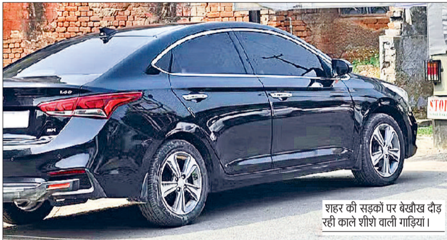
शहर की सड़कों पर बेखोज दौड़ रही काले शीशे वाली गाड़ियां।